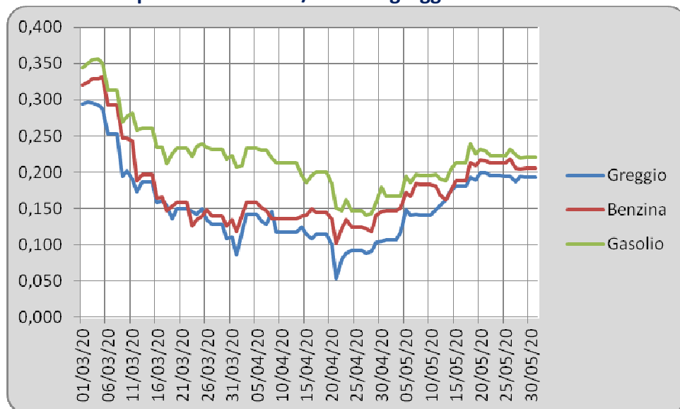
Grafico delle quotazioni in euro/litro del greggio Brent e della benzina e del gasolio CIF Mediterraneo

Come si siano trasferiti sul prezzo di vendita alla pompa gli effetti delle flessioni delle quotazioni internazionali è evidenziato dai grafici della pagina seguente: